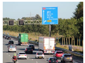
4 Tips voor werkgevers